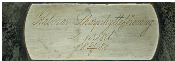
Inskriptionen på barometerns baksida.