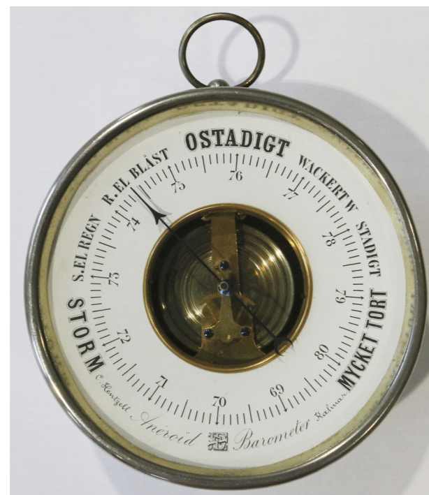
Den snart 140 år gamla barometern tycks fortfarande fungera precis som den ska. Den här bilden togs i torsdags förmiddag och visaren pekar på "Regn eller bläst" och båda dessa angivelserna stämde synnerligen väl in på det busväder som rådde vid tillfället.

Och det gjorde det den här gången. I tidningen Kalmar för lördagen den 20 augusti 1881, alltså dagen före prisbarometerns erövrats, fanns en notis om att Kalmar Skarpskyttekår redan föregående sommar hade bildat "Första pluto-