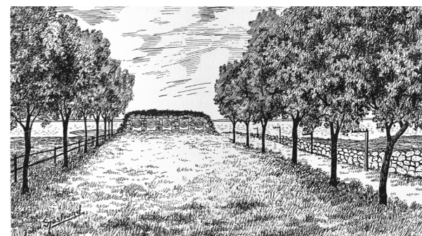
Skarpskyttarnas skjutbana i Kalmarsundsparken.

BILD UR SANCTE CHRISTOPHERS GILLES CHRONICA 1941