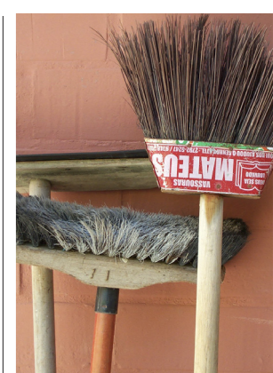
Lämplig vapenarsenal mot fluktare.

TECKNING AV JOHN SJÖSTRAND UR "GAMLA KALMARBILDER" (1927)