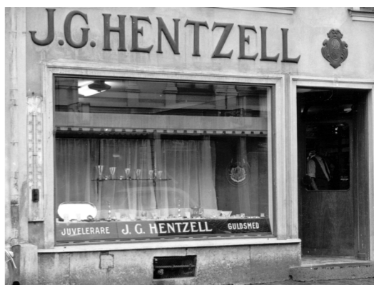
Guldsmedsfirmen J G Hentzells klassiska adress i Kalmar var Storgatan 22. I dag finns en vietnamesisk restaurang i huset. Bilden togs i slutet av 1950-talet men butiken fanns kvar mycket längre än så.